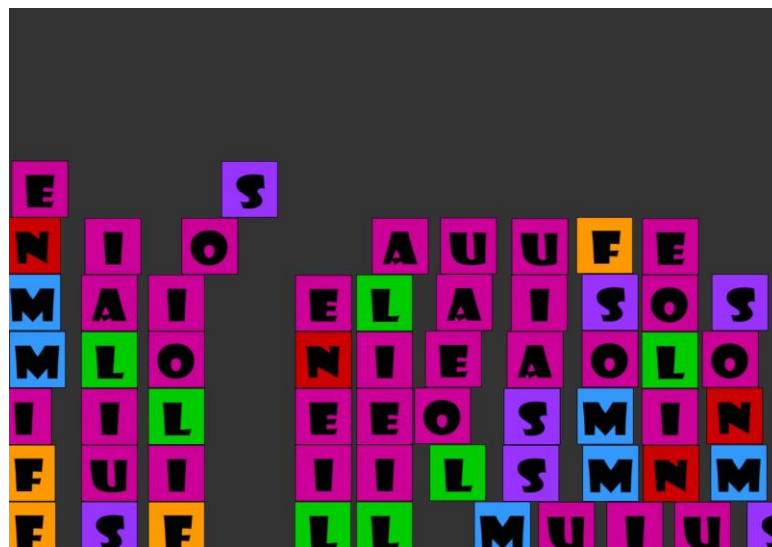
Caja de Letras 2